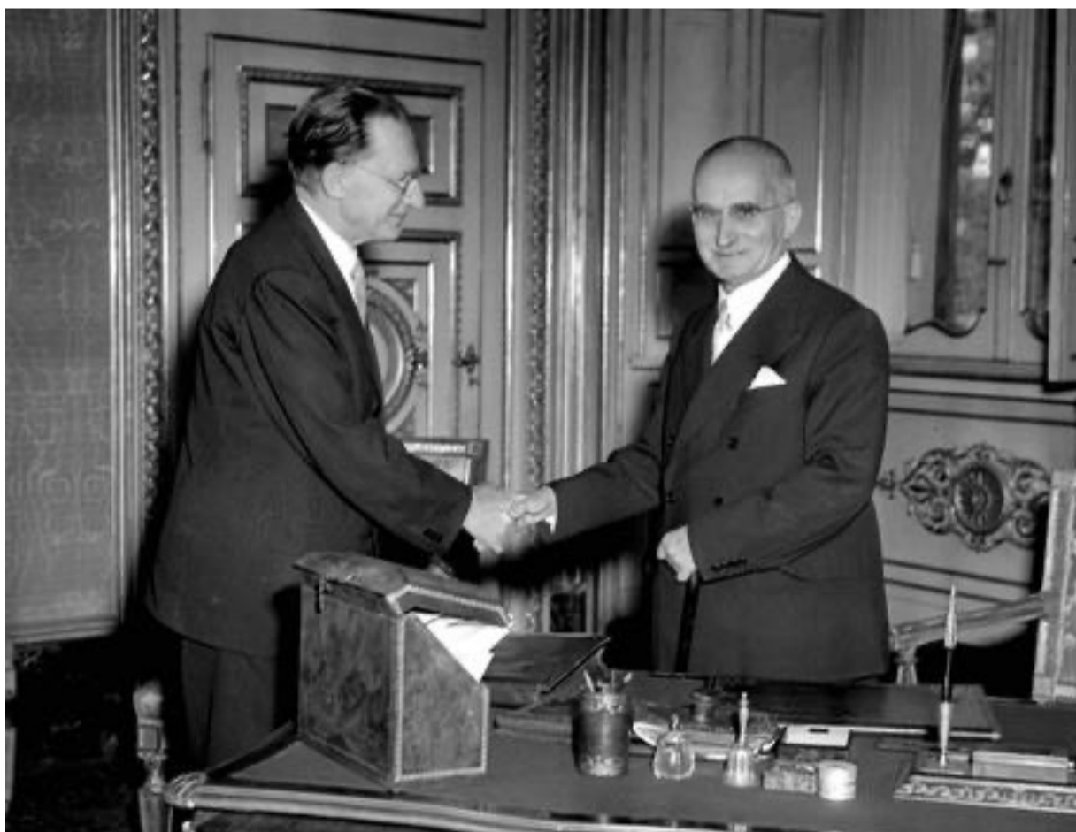
GIURAMENTO DEI MINISTRI STRETTA DI MANO TRA ALCIDE DE GASPERI E LUIGI EINAUDI 26 LUGLIO 1951.